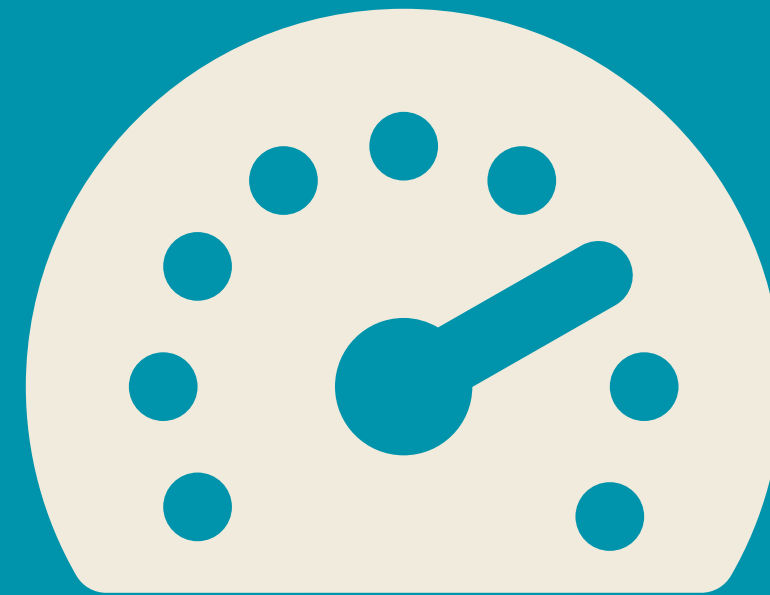
10M tai 4G Netin nopeus